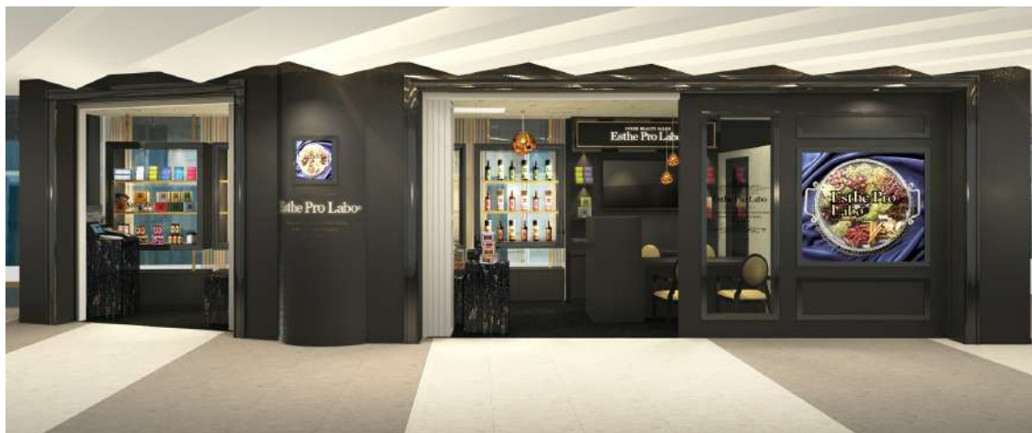
▲エステプロ・ラボROPPONGI

「エステプロ・ラボROPPONGI」は、最新の栄養学知識やノウハウを備えた管理栄養士などの専門資格者が、常駐している「インナービューティ（内面美容）」サロンです。