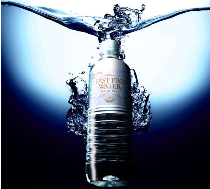
▲ファストプロウォーター 500ml

「ファストプロウォーター」は、“浸透力”と“機能性”“安全性”を重視し、良い水の条件7つをクリアした高機能性飲料水です。界面活性力(油を溶かす力)が水道水と比べ1.73倍高く、酵素活性力は通常の水道水と比べ1.64倍高いというエビデンスも取得致しました。また、クラスタの小ささも世界の奇跡の水と同等値を誇るなど機能性も重視しました。