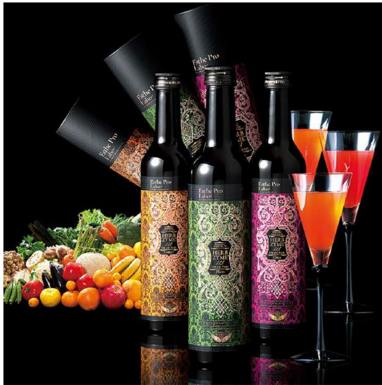
▲ハーブザイム113グランプロシリーズ

インナービューティサロン エステプロ・ラボでは、個人の体調やライフスタイルに合わせて、一人ひとりにあったファスティングプランを専属のカウンセラーと相談しながらオーダーメイドプログラムをつくります。