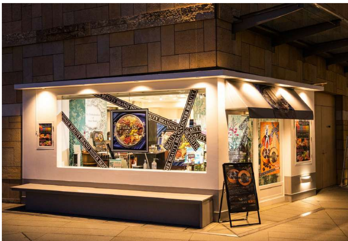
▲2020年2月出店の期間限定店舗