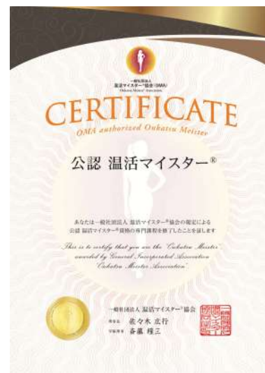
公認温活マスター®資格取得講座 ディプロマ