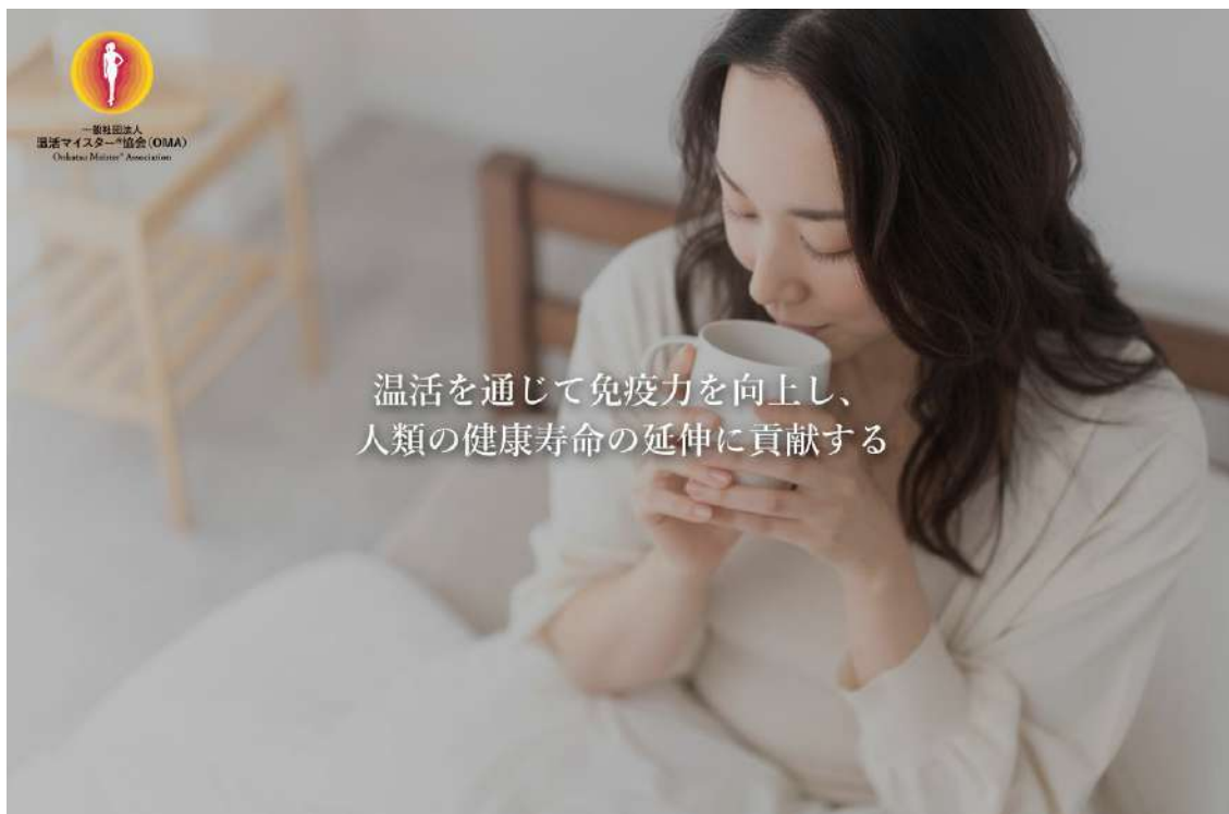
一般社団法人 温活マイスター®協会

「温活」、「腸活」、「免疫」、「冷え」、「睡眠」、「不妊」などを主な研究テーマとし、現役医師、学識者といった一流の役員、および講師陣を迎え、最新のエビデンスのある知識を医学レベルで普及いたします。