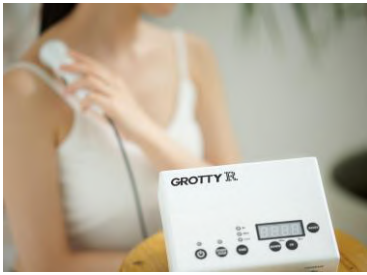
GROTTY R (グロッチェーアール)