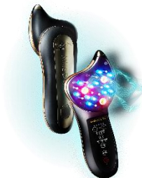
Milla Diva (ミラディーヴァ)

注2：NHK 健康チャンネル「健康を支える『エクソソーム』とは？その働きと効果、病気との関連性」（2021年11月25日付）< https://www.nhk.or.jp/kenko/atc_607.html >