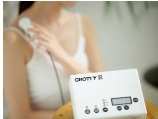
GROTTY R (グロッティ アール)