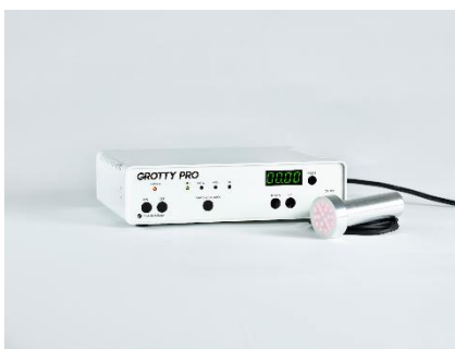
GROTTY PRO (グロッティ プロ)

同サロンでは、近赤外線と音響振動を用いた「GROTTY PRO (グロッティ プロ)」で顔や頭皮などに導入しトリートメントを行います。細胞に酸素や栄養素を運ぶ血管をケアするとともに、角質層深くまで届けます。