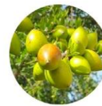
アルガニアスピノサ核油